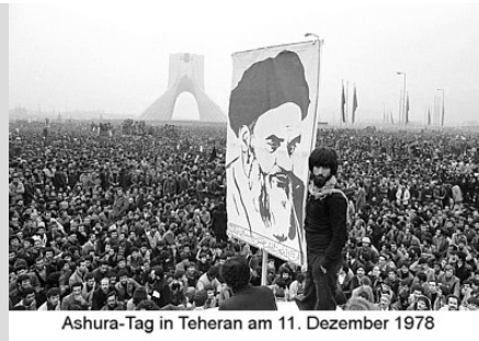
Ashura-Tag in Teheran am 11. Dezember 1978

Veröffentlicht: Donnerstag, 28. Februar 2019 23:49