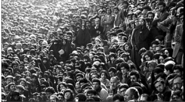
Die iranische Revolution wurde von Millionen von Menschen aus allen Lebensbereichen unterstützt.

Die Revolution kann auf zwei Kräfte, zwei Gruppen zurückgeführt werden. Auf die modernen und auf die traditionellen Kräfte.