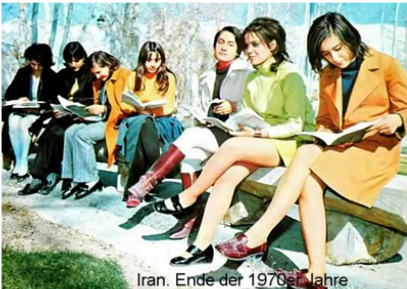
Iran. Ende der 1970er Jahre

Der Druck Carters auf den Shah hatte auch in der Gesellschaft Auswirkungen und führte zu einer politischen Öffnung im Iran. 1977 kam die Administration von Präsident Carter an die Schalthebeln in Washington. Menschenrechte waren auf der Agenda des neuen Präsidenten, der damit vor allem die Sowjetunion unter Druck setzen wollte. Um dieser Agenda einen glaubwürdigen Anstrich zu verleihen, forderten die USA auch von dem mit ihnen verbündeten Shah eine politische Öffnung. Widerwillig kam der Shah dem Wunsch der USA nach. Die darauf folgende relative Lockerung der polizeistaatlichen Kontrollen ermöglichte den Shah-Gegnern die Organisation von Protesten.