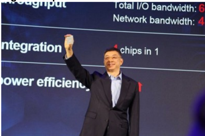
Huawei stellt den neuen CPU Chipset vor