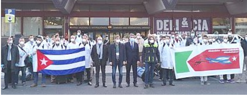
23.03.2020: Die Corona-Pandemie

führt zu neuen Konstellationen der internationalen Zusammenarbeit - Solidarität auf der einen, Entsolidarisierung auf der anderen Seite. Die Mitgliedsstaaten der Europäischen Union scheinen zur gegenseitigen Hilfe unfähig. China, Cuba und Russland stehen Italien im Kampf gegen das Virus bei.