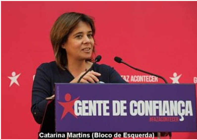
Catarina Martins (Bloco de Esquerda)

Catarina Martins, Koordinatorin des Linksblocks