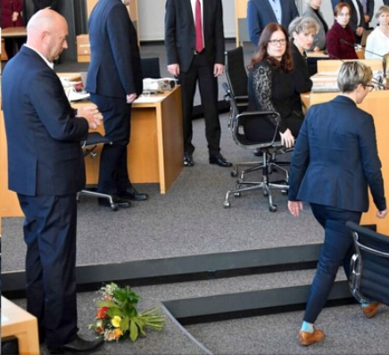
5.2.2020: Susanne Hennig-Wellsow (DIE LINKE) wirft den Blumenstrauß vor die Füße von Thomas Kemmerich (FDP), der mit den Stimmen der AfD zum Ministerpräsidentengewählt wurde.

https://twitter.com/ChrisCldtz/status/1225046067076571136