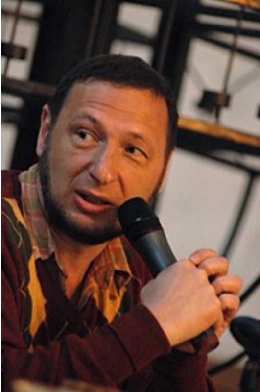
Von Boris Kagarlitzki, Direktor des „Instituts für Erforschung der Globalisierung und sozialen Bewegungen“ in Moskau.

13.05.2014: Die russischen Bürokraten waren sehr erstaunt über die Reaktionen des offiziellen Westens. Solch eine Entrüstung und einmütige Verurteilung hatten sie nicht erwartet. Europäische Politiker sind heftig erzürnt. Die Mainstream-Presse erzählt den LeserInnen fürchterliche Geschichten über die russische Aggression gegen die Ukraine. Das Fernsehen zeigt Interviews mit Kiewer Ministern und Abgeordneten, die mit Tränen in den Augen Europa anflehen, ihr Land vor dem grimmigen Bären zu retten.