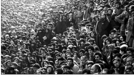
Die iranische Revolution wurde von Millionen von Menschen aus allen Lebensbereichen unterstützt.

Veröffentlicht: Donnerstag, 28. Februar 2019 23:49