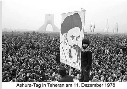
Ashura-Tag in Teheran am 11. Dezember 1978

Million Teilnehmern, mit dem Aufruf: "Nieder mit dem Schah". Es waren nicht nur die religiösen Kräfte vor Ort, sondern auch ein Großteil der Linken und Studenten. Neben dem allgemeinen Aufruf "Nieder mit dem Schah" hörte man auch "Es lebe Khomeini" von Tausenden und gar Hunderttausenden und von einigen hundert Menschen "Lange lebe der Fadaiyi" "Lang lebe der Mojahed".