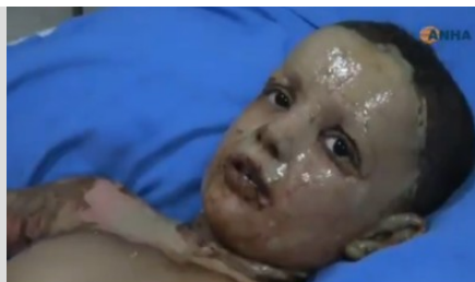
16.10.19: Einsatz "unkonventioneller" Waffen durch die Türkei.