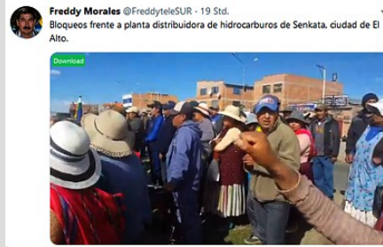
Blockade des Werkes für Treibstoff in Senkata

Veröffentlicht: Montag, 18. November 2019 10:19