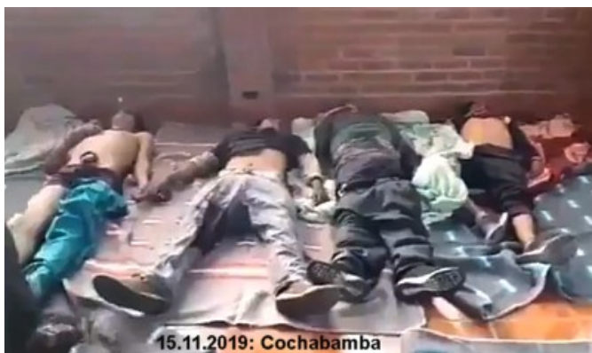
Cochabamba, 15.11.2019: nach dem Putsch von Polizei und Militär ermordet.

"seine Hände sind mit dem Blut der Bolivianer*innen befleckt" Evo Morales