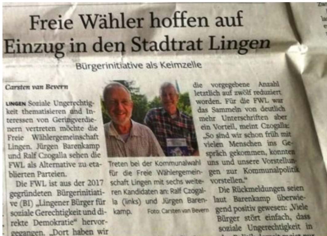
Artikel in der "Neue Osnabrücker Zeitung"

Der Unterschied zum Rest der Bundesrepublik ist jedoch, dass die oben genannten Probleme in Lingen verharmlost, wenn nicht sogar verkannt werden. Nur die FWL hat das Armutsproblem und die soziale Ungleichheit zu ihrem zentralen Gegenstand im Wahlkampf gemacht. Sonst wird das Problem in Lingen nur stark am Rande behandelt. Die meisten Lingener Stadtratspolitiker sind wohl der Auffassung, dass die relativ niedrige Arbeitslosenquote (ca. 3 %) das A und O sei. Armut ist aus ihrer Sichtweise etwas, was es in deutschen Großstädten wie Berlin gibt, aber nicht in Lingen. Tatsächlich hat aber zum Beispiel die Stadt Lingen eine höhere Austockerquote als z.B. Berlin (29.5 % > 27,2 %, Quelle: www.wegweiser-kommune.de , 2019). Aber selbst die vergleichsweise niedrigen Arbeitslosenquote bieten langfristig keine Sicherheit, z.B. hat noch in diesem Jahr das Werk des Acrylfaserherstellers Dralon geschlossen.