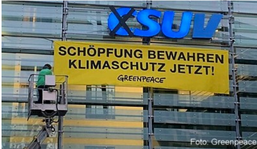
Aktion von Greenpeace am 16.10.19 an der CSU-Parteizentrale

Veröffentlicht: Donnerstag, 07. November 2019 12:08