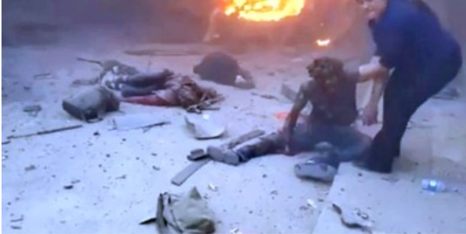
Bombardierung eines zivilen Konvois am 13.10.19; elf Menschen wurden getötet, 74 verletzt

Azaz, die bereits unter der Kontrolle türkischer Streitkräfte und/oder angeschlossener bewaffneter Gruppen stehen, weiterhin mit Gesetzlosigkeit und grassierender Kriminalität und Gewalt zu kämpfen haben. Wir haben konkrete Berichte über Einschüchterung, Misshandlung, Tötung, Entführung, Plünderung und Beschlagnahme von Häusern von Zivilist*innen durch die türkisch unterstützten bewaffneten Gruppen in diesen Gebieten erhalten."