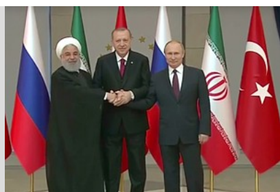
Trio Infernale über die Zukunft Syriens (06.04.2018)

Mit dem Abkommen Russland - Türkei wird nicht nur Afrin dem türkischen Faschismus zum Fraß vorgeworfen, sondern ganz Nordsyrien mit seiner multiethnischen Bevölkerung. Die neo-osmanischen Großmachtphantasien Erdoğan werden dadurch nicht gebremst. Im Gegenteil. Das nächste Ziel könnte Südkurdistan/Irak werden, befürchten Vertreter der Kurdischen Regionalregierung im Norden des Irak.