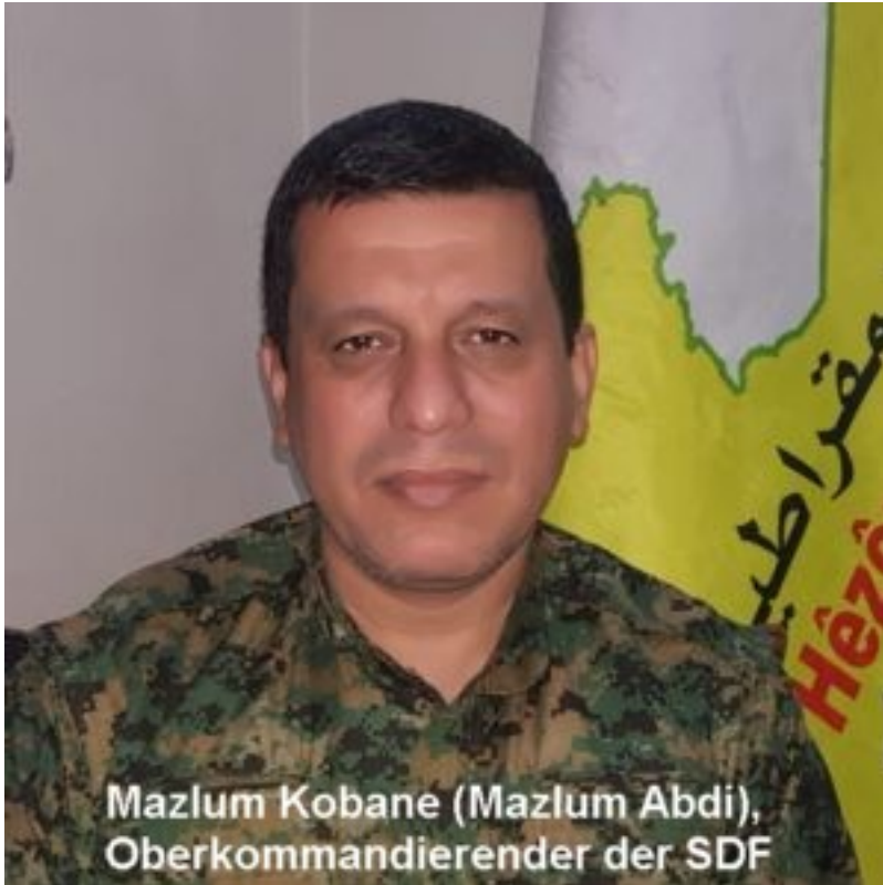
Mazlum Kobane (Mazlum Abdi), Oberkommandierender der SDF

27.08.2019: Der türkische Staat will Nord- und Ostsyrien unter dem Vorwand einer »Sicherheitszone« besetzen ++ Verhandlungen USA - Türkei über »Sicherheitszone« ++ erste Schritte für Installation eines »Sicherheitsmechanismus« eingeleitet: US- und türkisches Militär kontrollieren gemeinsam, YPG zieht sich aus Pufferzone zurück, lokaler Militärrat übernimmt die Verteidigung ++ Verhandlungen gehen weiter. Die Syrisch Demokratischen Kräfte (SDF) nehmen indirekt teil ++ Interview mit SDF-Kommandant Mazlum Abdi Der türkische Staat will Nord- und Ostsyrien unter dem Vorwand einer »Sicherheitszone« besetzen. In der letzten Zeit findet insbesondere auf der Linie entlang des Euphrat bis nach Serêkaniyê ein massiver Aufmarsch der türkischen Armee statt. Die Türkei will eine Zone einrichten, die am Euphrat beginnt und sich bis zur südkurdischen Grenze über 460 Kilometer Breite und zwischen 30 und 35 Kilometer Tiefe erstreckt und vollständig unter ihrer Kontrolle steht. Die Autonomieverwaltung soll sich nach den Vorstellungen Erdo?ans aus dem Gebiet zurückziehen.