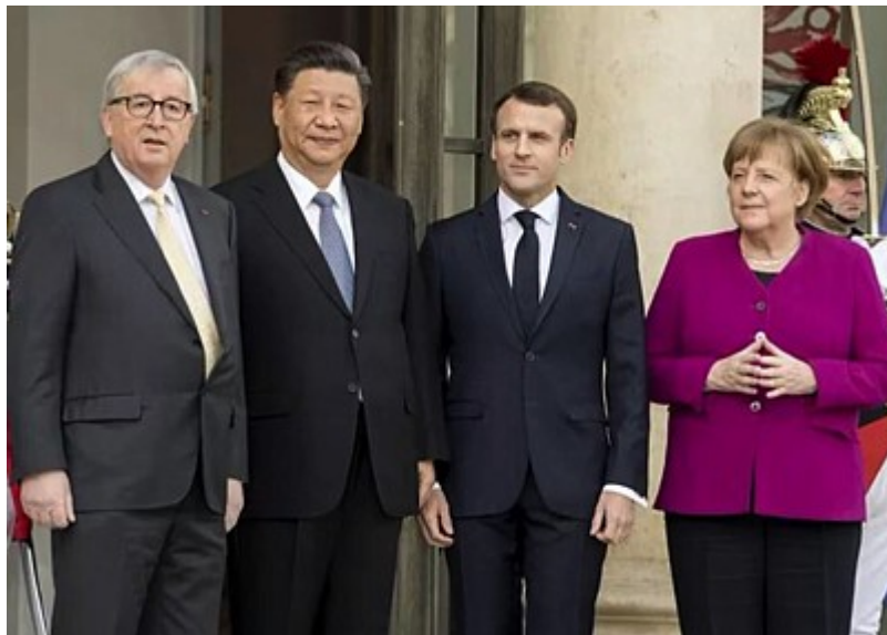
01.04.2019: Chinas Staatspräsidenten